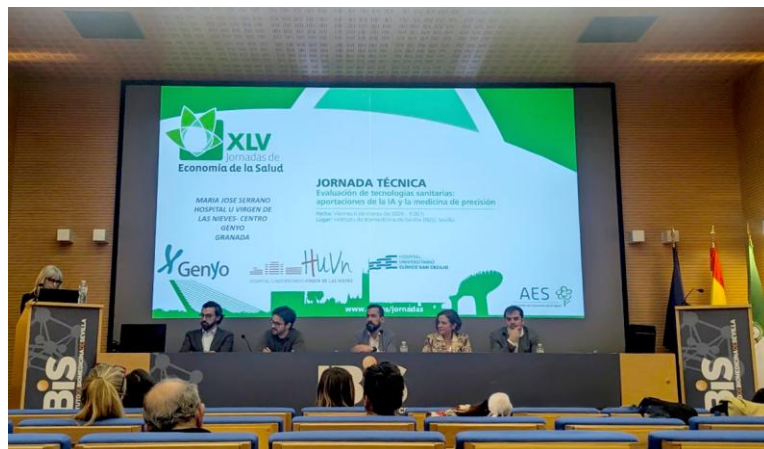
Imagen de los diálogos mantenidos durante la Jornada Técnica