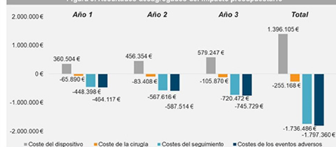
Figura 3. Resultados desagregados del impacto presupuestario

Los diferentes escenarios de penetración de iStent inject® muestran ahorros potenciales entre 1.647.776 € (menor penetración) y 3.128.413 € (mayor penetración).