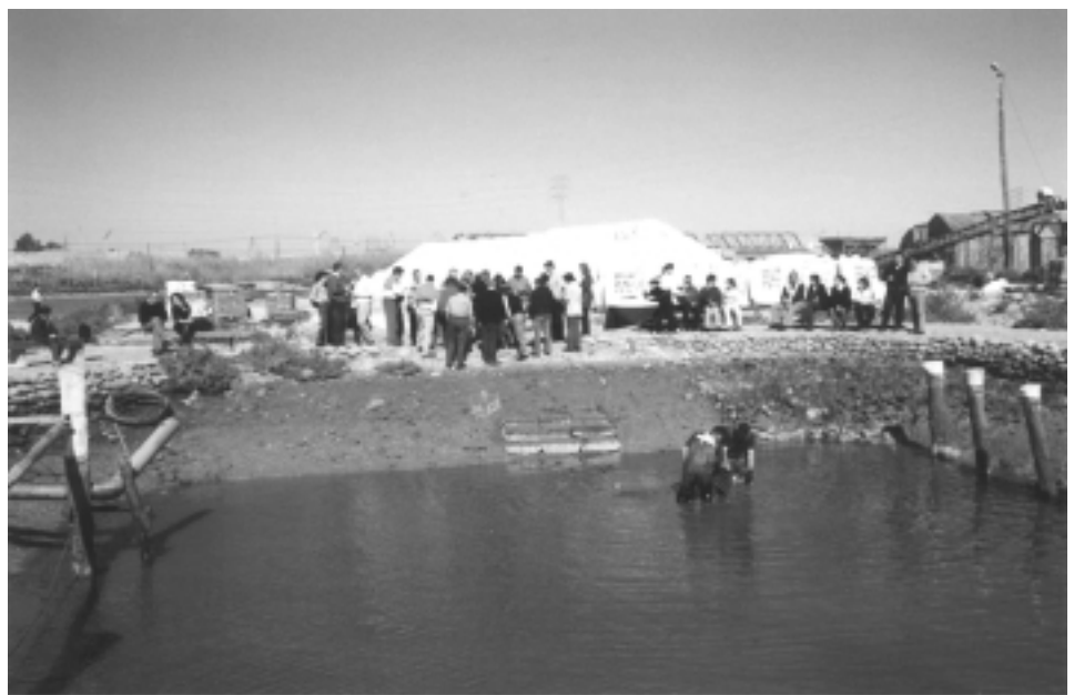
Despesque en el estero de la salina de San Vicente